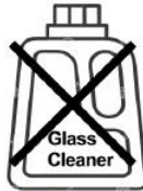
Nettoyant pour vitres